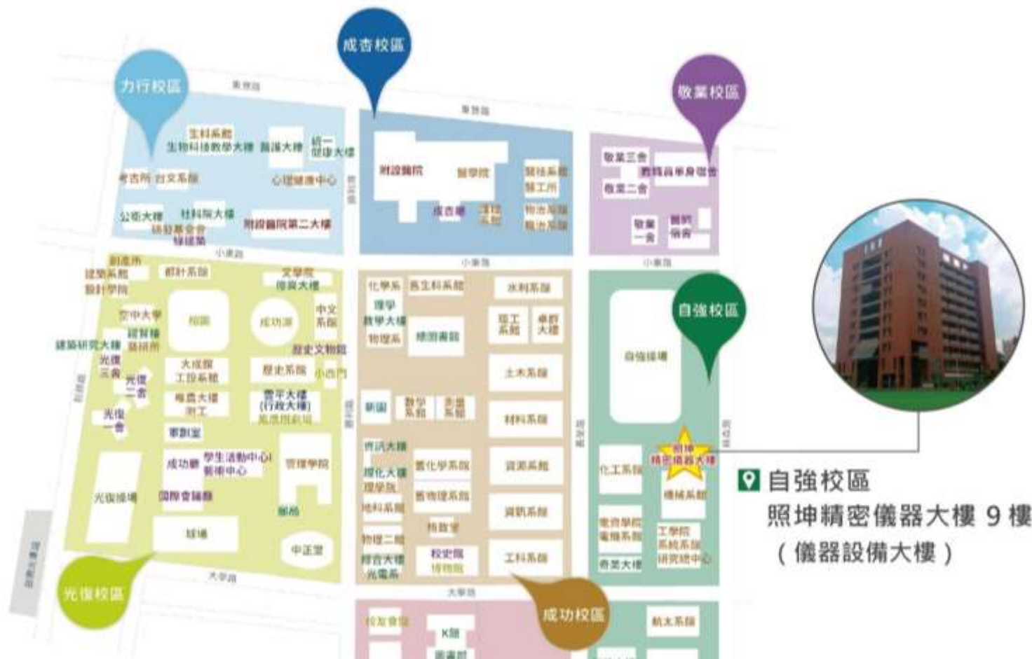
國立成功大學自強校區儀器設備大樓位置圖：